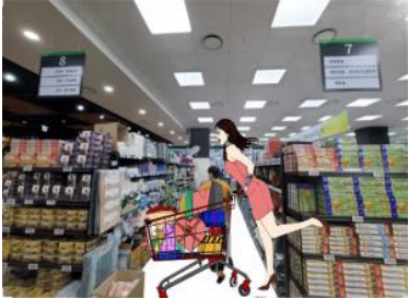
ตามเงื่อนไขของร้านด้วย

จากนั้นพาท่านเดินทางสู่ Supermarket หรือที่นักท่องเที่ยวเรียกกันว่า "ร้านละลายเงินวอน" ที่นี้มีขนม ของฝาก ของ