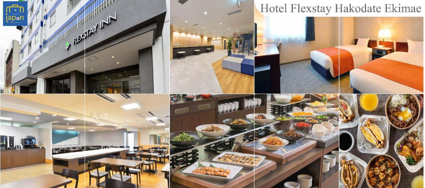
Hotel Flexstay Hakodate Ekimae

FLEX STAY INN HAKODATE EKIMAE หรือเทียบเท่าระดับเดียวกัน