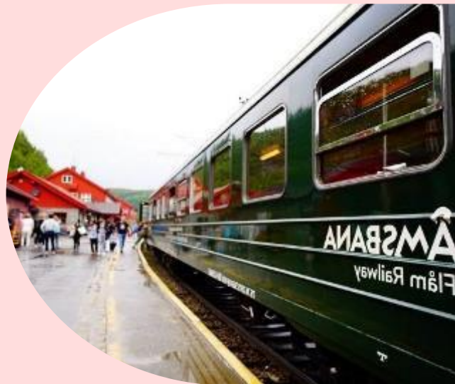
มาก นาทกม

นำท่าน นั่งรถไฟสายโรแมนติก “ฟลัมสบานา” จาก เมืองฟลัม สู่ เมืองไมร์ดัล (Flamsbana Railway from Flam to Myrdal) เส้นทางรถไฟที่โด่งดังที่สุดของประเทศนอร์เวย์ นักท่องเที่ยวจะได้ลัดเลาะไปตาม หุบเขาที่สวยงามของประเทศนอร์เวย์ โดยรถไฟจะวิ่งผ่านอุโมงค์จำนวน 20 แห่ง โดยมีอุโมงค์ 18 แห่งได้ใช้แรงงานคนขุด ซึ่งระหว่างทางท่านจะได้ชื่นชมกับทัศนียภาพอันงดงามที่ธรรมชาติสรรค์สร้างแสนน่าประทับใจของหุบเขาอันสูงชัน และธารน้ำแข็งกลาเซียร์ แห่งฟยอร์ด ไปจนถึงเมืองไมร์ดัล (Myrdal) ในระหว่างทางที่นั่งรถไฟ นักท่องเที่ยวจะได้หยุดชมความสวยงามของ น้ำตกจอสฟอสเซ่น (Kjosfossen) หนึ่งในจุดท่องเที่ยวที่มีความสวยงามและได้รับความนิยมจากนักท่องเที่ยวเป็นอย่างมาก จุดที่มีความสูงประมาณ 225 เมตร ส่วนน้ำในน้ำตกนั้นไหลมาจากทะเลสาบบนเทือกเขาชื่อทะเลสาบเรนนีกาวัตเน็ต (Reinungavatnet) และทะเลสาบเซลเทฟวัตเน็ต (Seltuftvatnet) หลังจากนั้นขึ้นรถไฟขบวนต่อไปตลอดเส้นทางจนกระทั่งถึงเมืองไมร์ดัลซึ่งเป็นสถานีสุดท้ายของการนั่งรถไฟสายโรแมนติกนั่นเอง