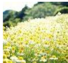
German Chamomile May to June