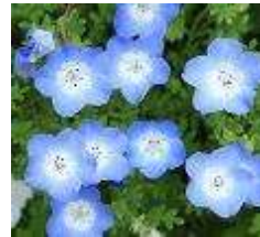
Nemophila April to May