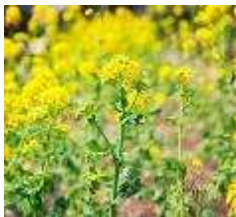
Field Mustard March to April