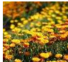
Pot Marigold April to June