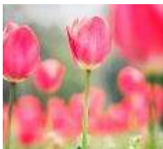
Tulip March to April