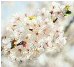
Mountain Cherry Blossoms March to April