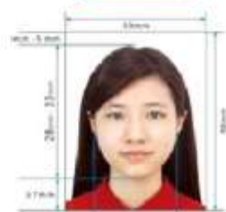
28mm - 35mm Paper Photo for Visa Application Form