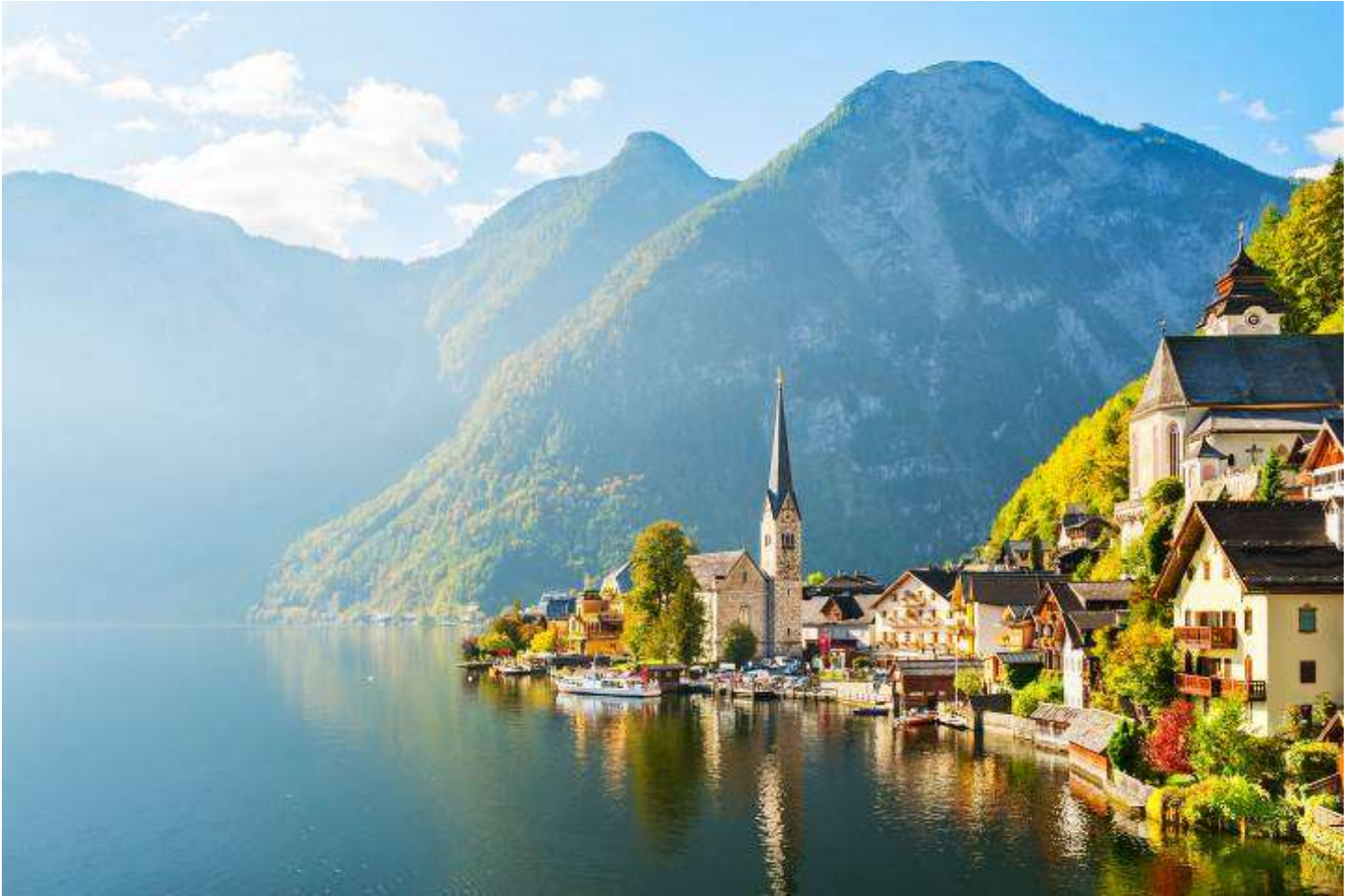
นำท่านเดินทางสู่เมือง เชสกี ครุมลอฟ (CESKY KRUMLOV) (ระยะทาง 203 กม. ใช้เวลาประมาณ 2.30 ชม.)