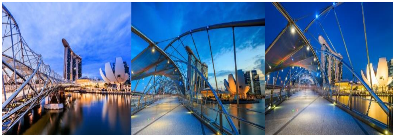
การออกแบบโครงสร้างสะพานด้วย

นำท่านเดินทางสู่ ถ่ายรูปสะพานเกลียวเฮลิคซ์ (HELIX BRIDGE) เป็นสะพานที่มีรูปทรงทันสมัยและสวยงามที่สุด สะพานหนึ่งของประเทศสิงคโปร์อยู่ที่อ่าวมาริน่าเป็นสะพานที่นอกจากจะมีสวยงามและแปลกตาไม่เหมือนที่อื่น ๆ แล้ว ยังมีความน่าสนใจตั้งแต่คอนเซ็ปของการออกแบบแล้ว คือมีการใช้เหล็กที่มีลักษณะเป็นท่อ 2 อันที่จะหมุนพันกันไปเรื่อยๆตามความยาวของสะพานที่เอาแนวคิดมากจากรูปแบบของดีเอ็นเอ ซึ่งนอกจากความสวยงามแล้วยังช่วยเรื่อง