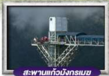
สะพานแก้วมังกรเมฆ