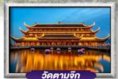
วัดตามจุก