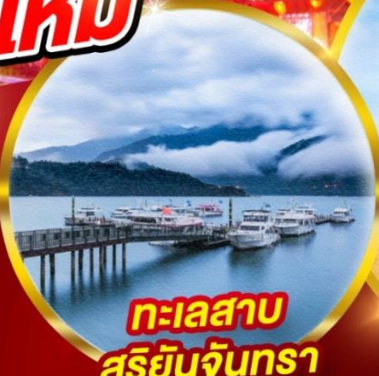
ทะเลสาบ สุริยันจันทรา

เดินทาง วันที่ 28-31 ธ.ค.65/ 31 ธ.ค.65-03 ม.ค.66/01-04 ม.ค.66