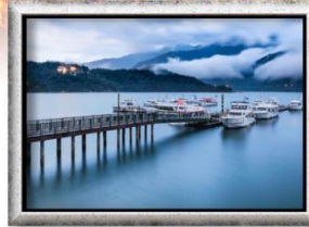
ทะเลสาบสุริยอันจินทรา