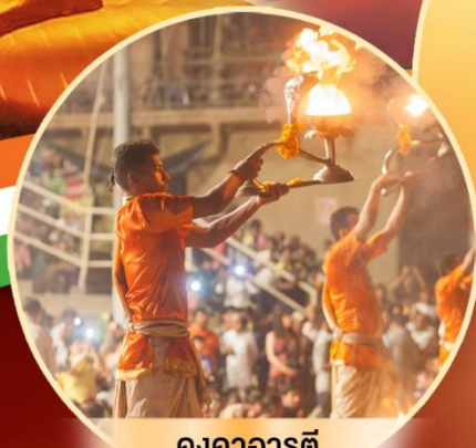
คงคาอารตี