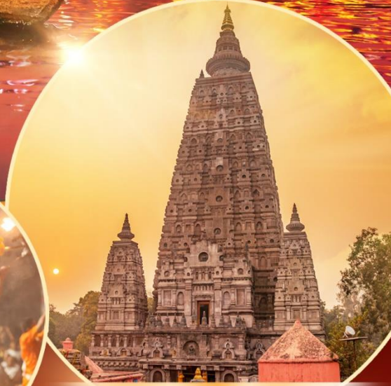
พระมหาเจดีย์พุทธคยา