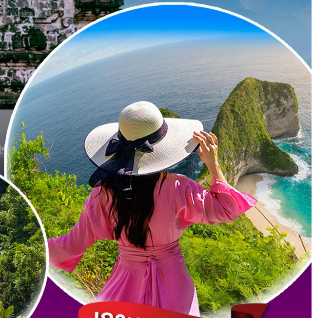
เกาะบูซา ปันดา