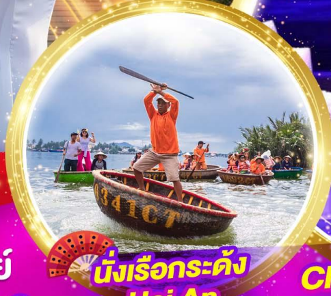
นั่งเรือกระด้ง Hoi An