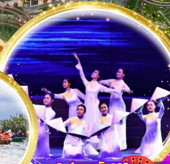
โชว์สุดอลังการ Charming at danang