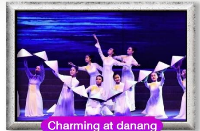
Charming at danang